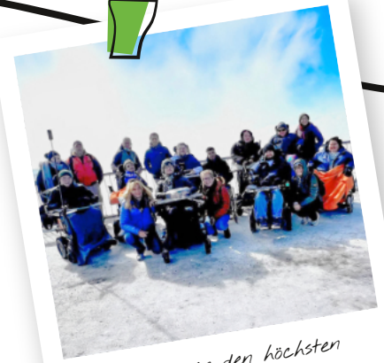
Zusammen den höchsten Berg erklimmen