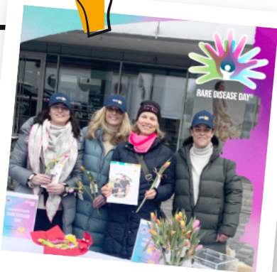
Tag der Seltener Erkrankungen