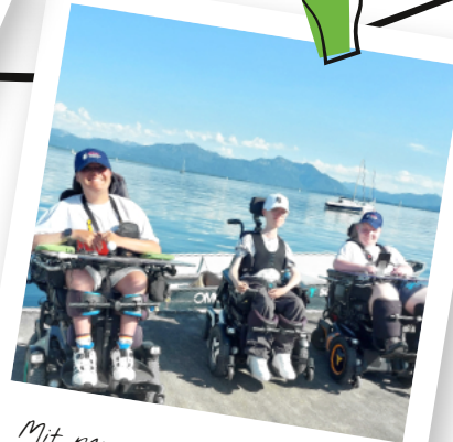
Mit neuen Freunden unterwegs