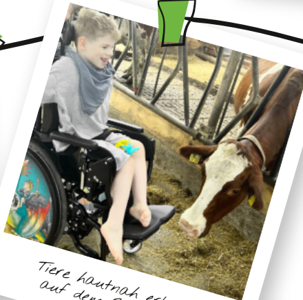
Tiere hautnah erleben auf dem Bauernhof