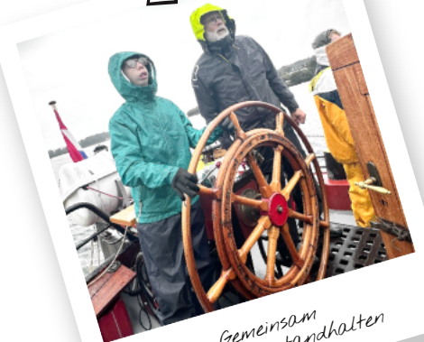
Gemeinsam dem Sturm standhalten