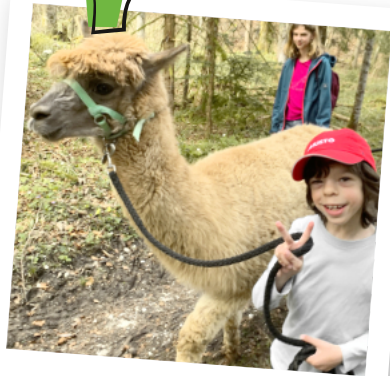
Gemeinsam neue Wege gehen