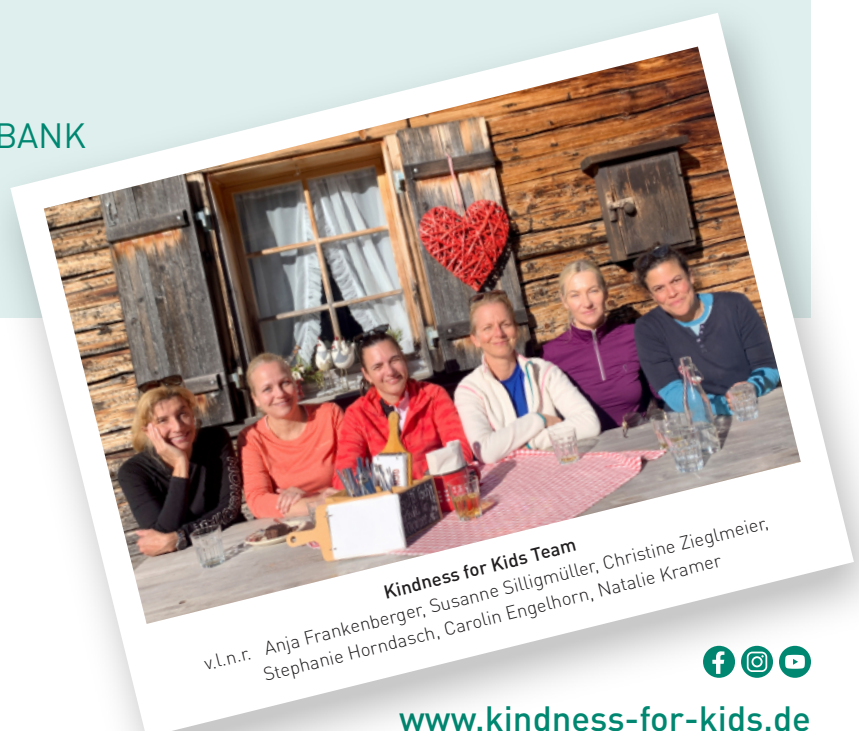
Kindness for Kids Team