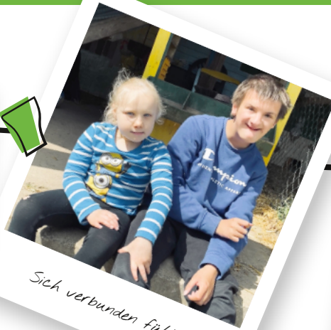
Sich verbunden fühlen