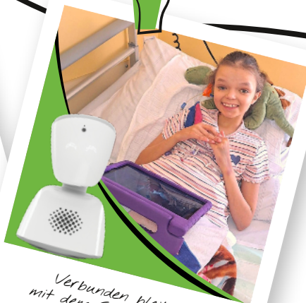
Verbunden bleiben mit dem Schul-Avatar