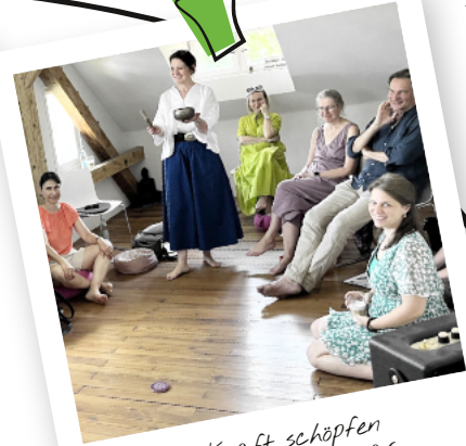
Kraft schöpfen im Elternseminar

In jedem sozialen Angebot entstehen Begegnungen, Zuversicht und es eröffnen sich neue Wege. Sie alle schenken Kindern und deren Familien Momente der Entlastung und des Miteinanders. Was bleibt, sind Erinnerungen, die tragen und das Wissen, nicht allein zu sein. Genau diese Begegnungen sind es, die uns berühren und motivieren. Kinder, die lachen. Eltern, die durchatmen. Familien, die neue Hoffnung schöpfen. Und gleichzeitig sind das die Momente, die unsere Arbeit tragen und uns zeigen, warum wir tun, was wir tun.