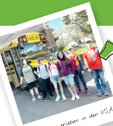
Abenteuer erleben in den USA