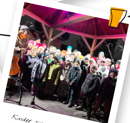
Kinder singen für Kinder