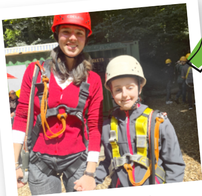
Sich geborgen fühlen im Kindercamp