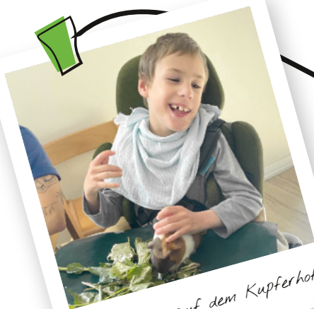
Auftanken auf dem Kupferhof

Jedes unserer Projekte, jedes Foto aus 2025 erzählt seine eigene Geschichte und doch sind alle durch eines verbunden: soziale Teilhabe, die erkrankten Kindern so sehr fehlt. Sie erzählen von Freude, Herzlichkeit und Zusammenhalt – und davon, wie wir im Kleinen Großes bewirken können. Ob beim Camp oder in einer Familienauszeit, ob am Chiemsee oder auf der Ostsee – es geht immer um das Gefühl, dazugehören, gesehen zu werden und gemeinsam weiterzugehen.