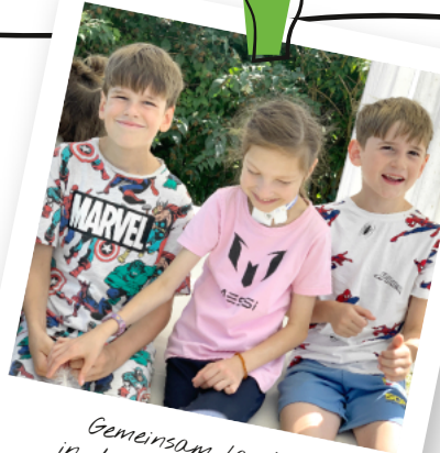
Gemeinsam lachen in der Familienauszeit