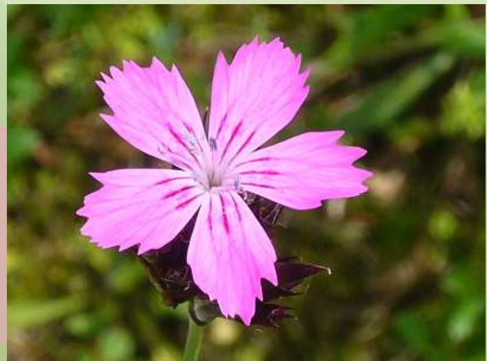
Karthäusernelke Dianthus carthusianorum

Angeblich früher häufig von Karthäuser-Mönchen angepflanzt; enthält Saponine, das mit Wasser Schaum ergibt und zum Waschen verwendet wurde.