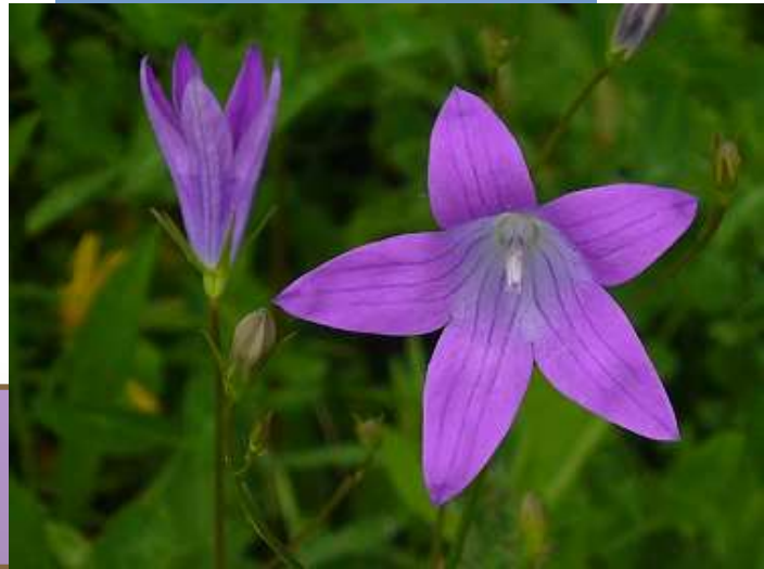
Wiesen-Glockenblume Campanula pratensis

Früher Heil- mittel gegen Krätze (scabies = lat.: Grind)