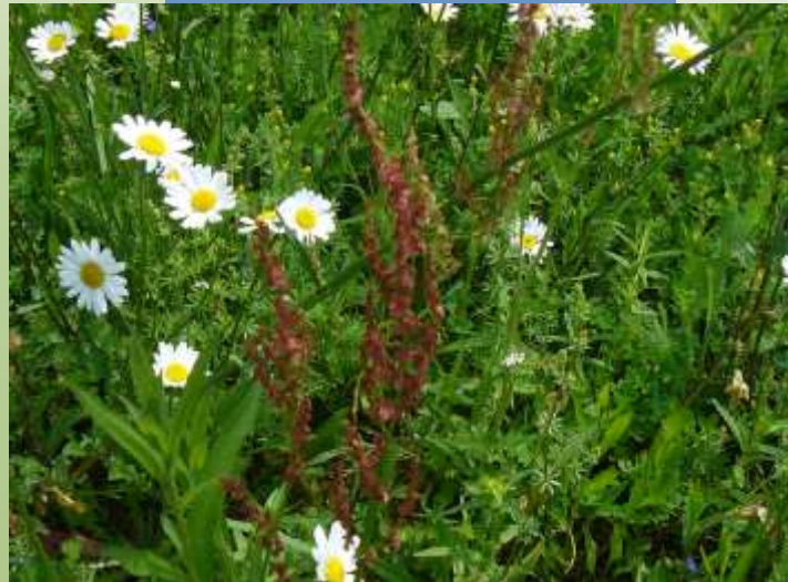
Sauerampfer Rumex acetosa

Die Blätter schmecken durch den Oxalsäure- Gehalt säuerlich und werden klein geschnitten Salaten hinzugefügt.