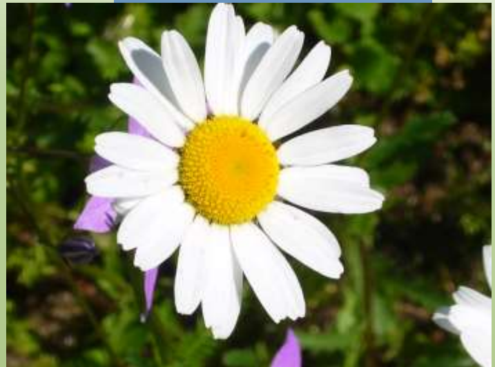
Margerite Leucanthemum vulgare