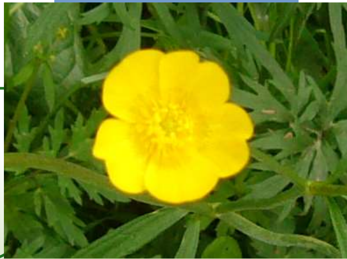
Scharfer Hahnenfuß Ranunculus acer

Die frische Pflanze enthält ein scharf schmeckendes Gift, sodass Weidevieh die Pflanze verschmäht.