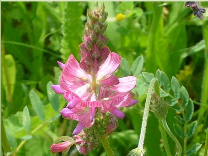
Esparsette Onobrychis viciaefolia

Der botanische Name „Onobrychis“ leitet sich vom Griechischen ab und bedeutet Eselsfraß.