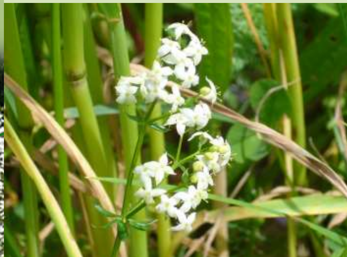
Wiesen-Labkraut Galium mollugo

In Labkraut ist Lab enthalten, das Milch zum Gerinnen bringt und daher zur Käseherstellung verwendet wurde..