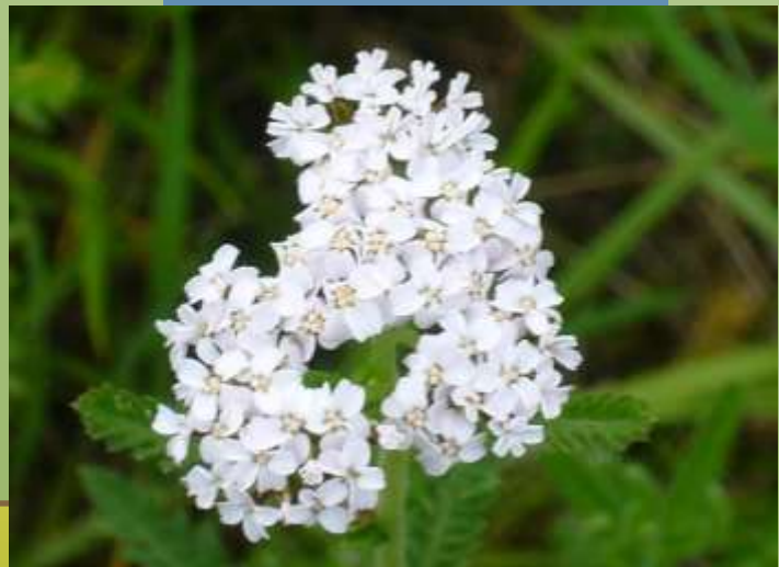
Schafgarbe Achillea millefolium

Kraut und Blüten wirken getrocknet antiseptisch.