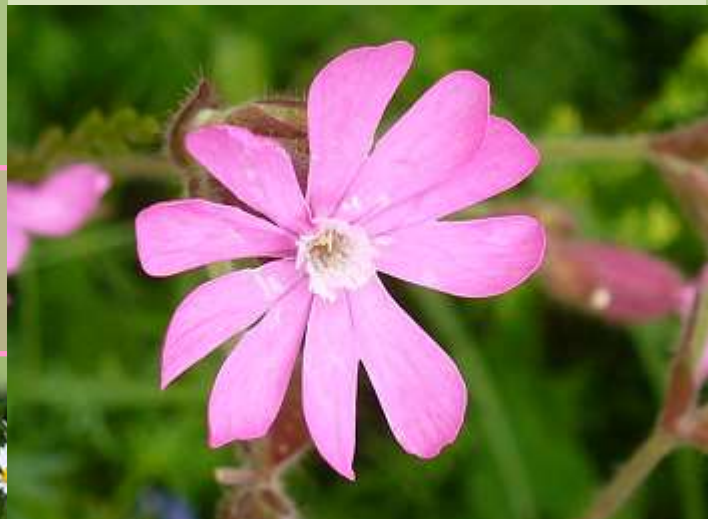
Rote Lichtnelke Silene dioica

Bestäubung durch Schmetterlinge und Hummeln