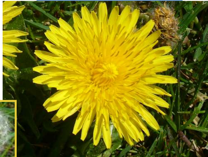
Gemeiner Löwenzahn Taraxacum officinale