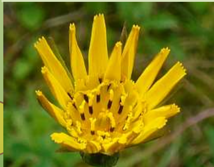
Wiesen-Bocksbart Tragopogon pratensis

Verblüht erinnert er angeblich an den Bart eines Ziegenbocks.