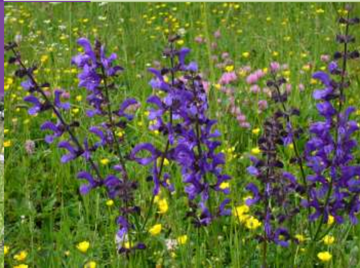
Wiesen-Salbei Salvia pratensis

Salvia officinalis dient als Arzneipflanze . Sie wirkt schweißhemmend