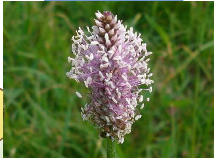
Spitzwegerich Plantago lanceolata

Der Saft der Stängel verringert Schwellungen bei Insektenstichen.