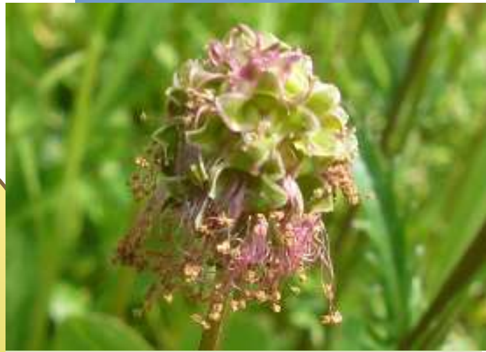
kleiner Wiesenknopf Sanguisorba minor

Form und Farbe ergaben den lateinischen Namen: Sanguisorba = Blutkugel