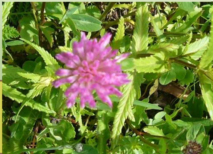
Rotklee Trifolium pratense

in Deutschland seit dem 11. Jahrhundert als wichtige, eiweißreiche Futterpflanze angebaut.