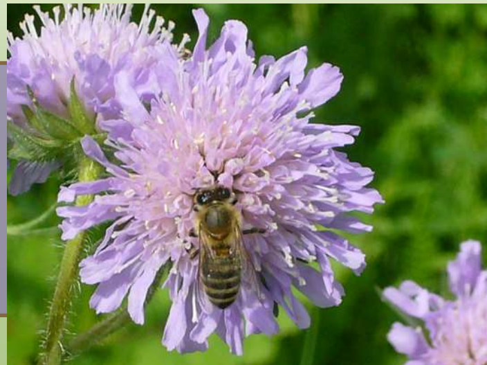
Taubenskabiose Scabiosa columbaria

Früher Heil- mittel gegen Krätze (scabies = lat.: Grind)