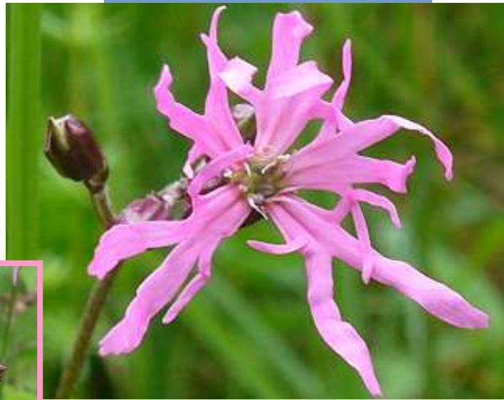
Kuckuckslichtnelke Lychnis flos cuculi

Angeblich früher häufig von Karthäuser-Mönchen angepflanzt; enthält Saponine, das mit Wasser Schaum ergibt und zum Waschen verwendet wurde.