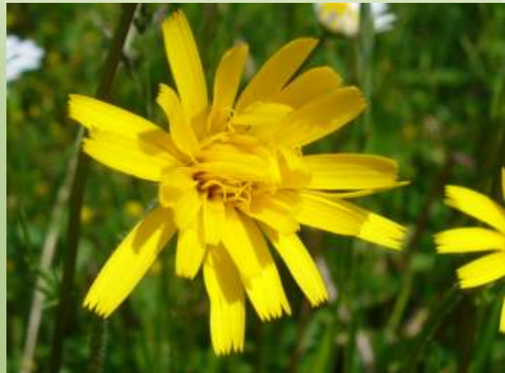
Rauher Löwenzahn Leontodon hispidus