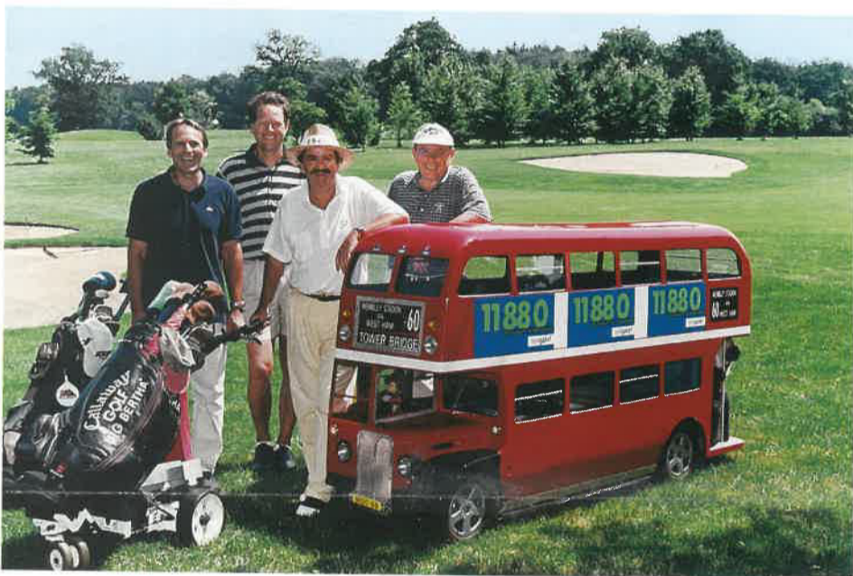
Telegate, die neue, clevere Auskunft mit der Nummer 11880.