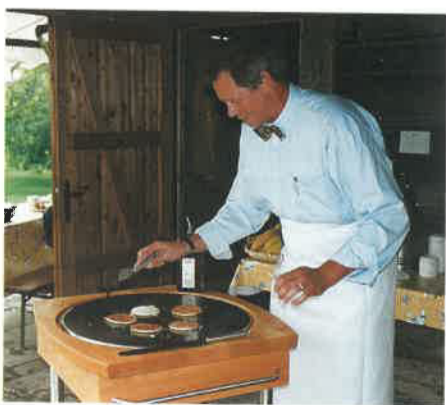
Küchen Dross und Schaffer verwöhnte uns mit eigenem Koch und neuester Küchentechnik am 9. Loch