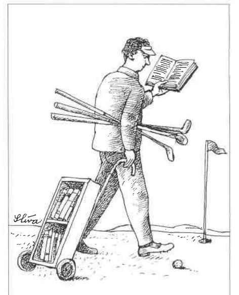
aus: „Börsenblatt des Deutschen Buchhandels“