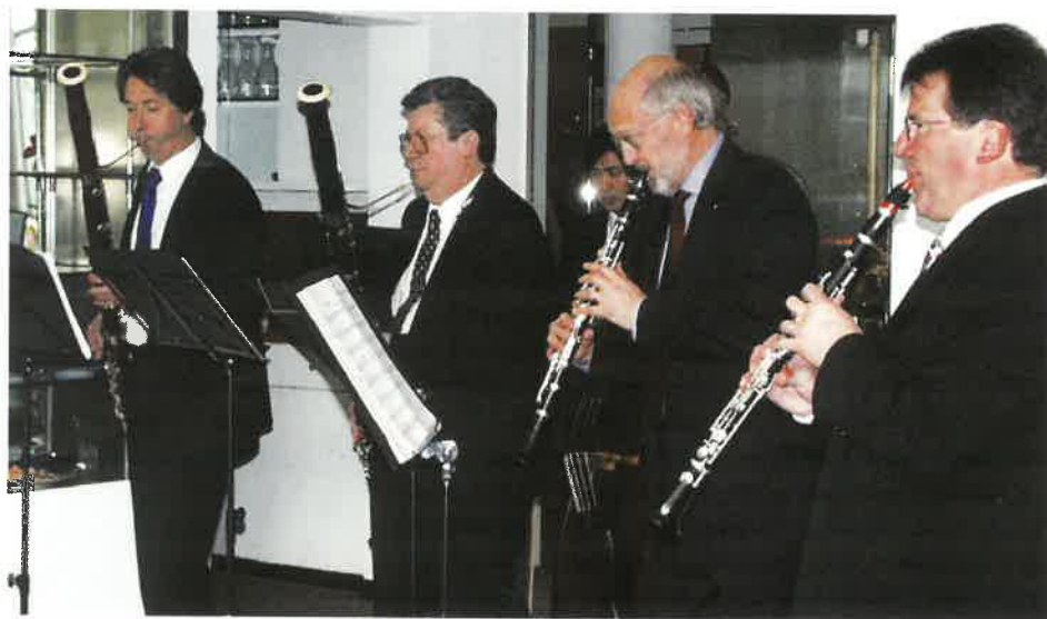
Gelungene Matinée am 2. Advent letzten Jahres

Wenn zur sorgfältigen Vorbereitung dann auch das notwendige Quantum