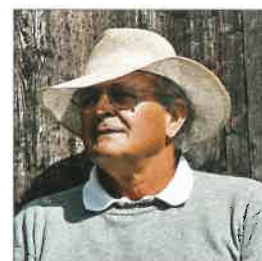
„Golfspieler ist, wer Regeln und Etikette beherrscht.“