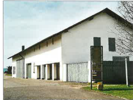
Der Umbau der Remise hat begonnen ...

Einige Turniere werden unverändert auch in der kommenden Saison stattfinden, so der Greenkeeper Cup, einfach deshalb, weil sie nichts von ihrer Attraktivität verloren haben.