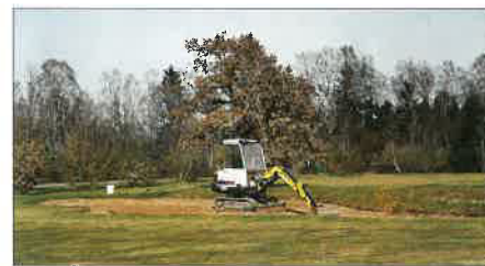
... und auch der an den Bunkern

Zusammenfassend ist sich der Schreiber – und hoffentlich bald auch Sie! – sicher: „Das Bessere ist des Guten Feind!“