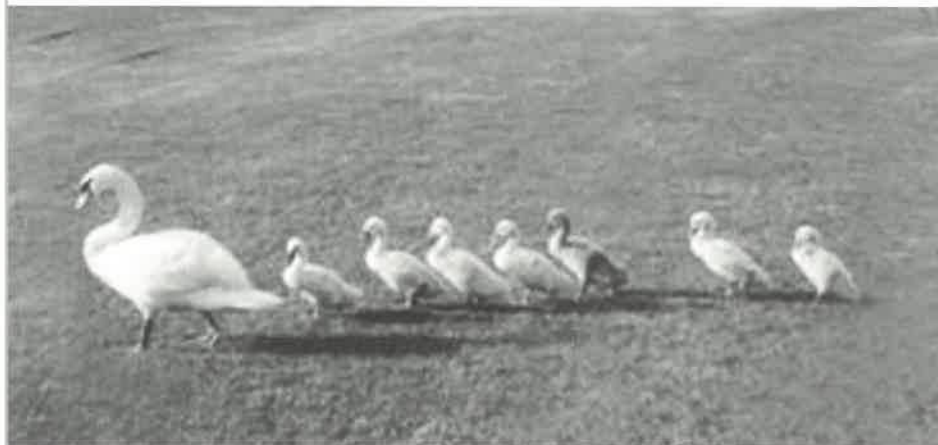
Eine Empfehlung der Tee-Times-Redaktion an die Mitglieder und Gäste für die neue Saison