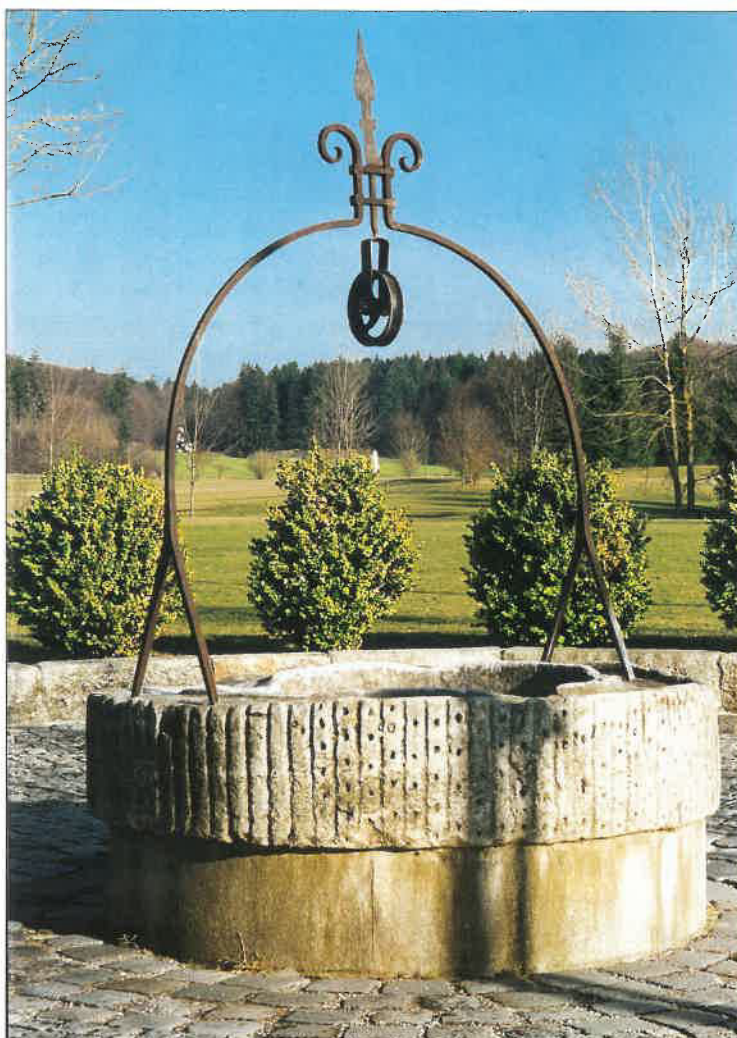
... hat mehrere hundert Jahre in einem italienischen Dorf seine Dienste getan

Eine Reihe von namhaften und hervorragenden Clubs hat Interesse bekundet und wird innerhalb der nächsten Monate hinzukommen. Die Gemeinschaft der „Leading Golf Courses of Germany“ wird eine neue Dimension an Qualität und Wettbewerbsfähigkeit innerhalb einer sich gefährlich entwickelnden Golf-szene in Deutschland schaffen.