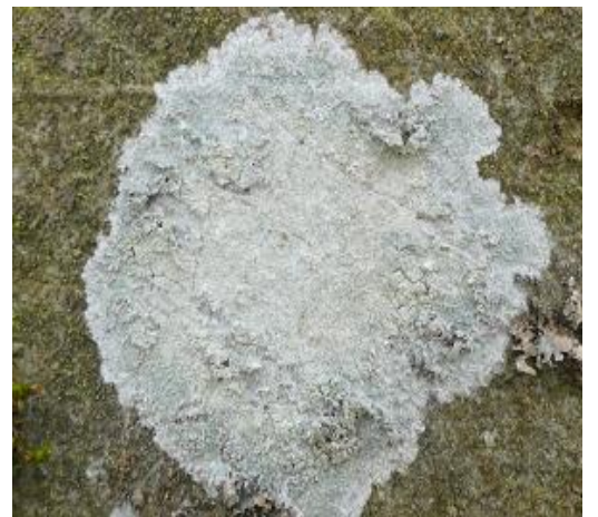
an Rotbuche Bahn 3

Krustenflechten sind wie Krusten auf dem Untergrund festgewachsen.