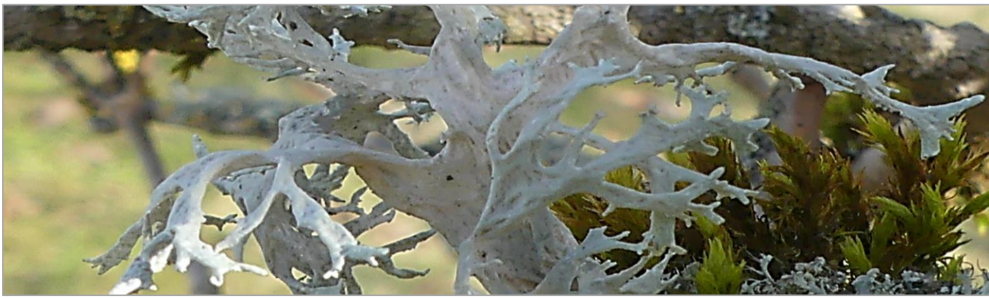
Strauchflechte auf Holunder an Bahn 5