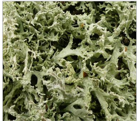
an Stieleiche an der Umgehungsstraße Bahn 14

Strauchflechten sehen wie kleine Äste oder Sträucher aus oder hängen als Bärte herab.