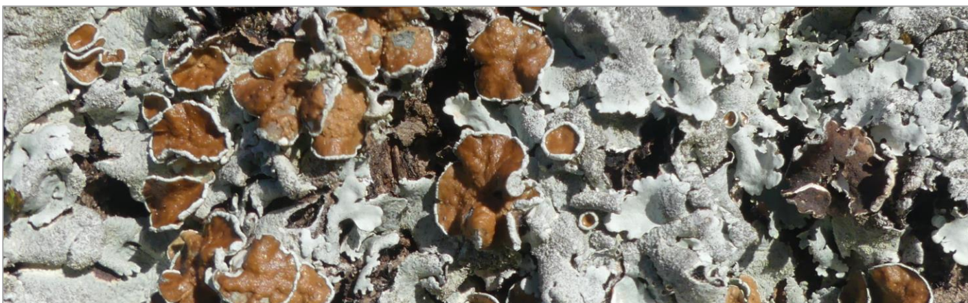
Blattflechte an Linde an der Einfahrtsallee

Gewisse Flechten verströmen einen angenehmen Geruch, der in Parfüm verwendet wird. Früher wurden auch Textilien und Wolle mit Flechten gelb und braun gefärbt.