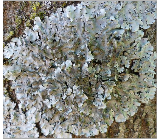
an Esche Bahn 14

Blattflechten liegen locker auf dem Untergrund auf und wirken lappig-flächig.