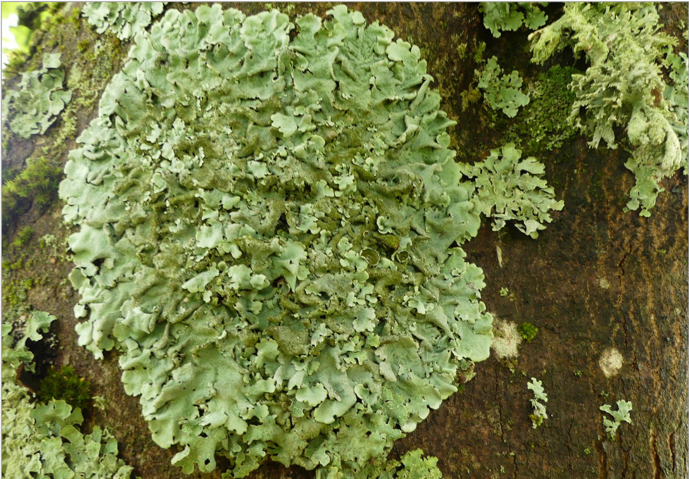
Blattflechte an Bergahorn an Bahn 13

Oft übersehen und doch gut, dass es sie auf dem Golfplatz gibt! Denn sie sind ein Beweis für gute Luft.