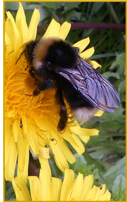
Löwenzahn-Blüte, Bahn 16

Ein Hummelvolk lebt im Gegensatz zum Volk der Honigbienen nur ein Jahr.