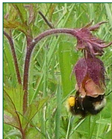
Bachnelkenwurz-Blüte, Bahn 7

Die produzierten Mengen reichen für die eigene Versorgung, sind aber so gering, dass sich eine Ausbeutung für den Menschen nicht lohnt.